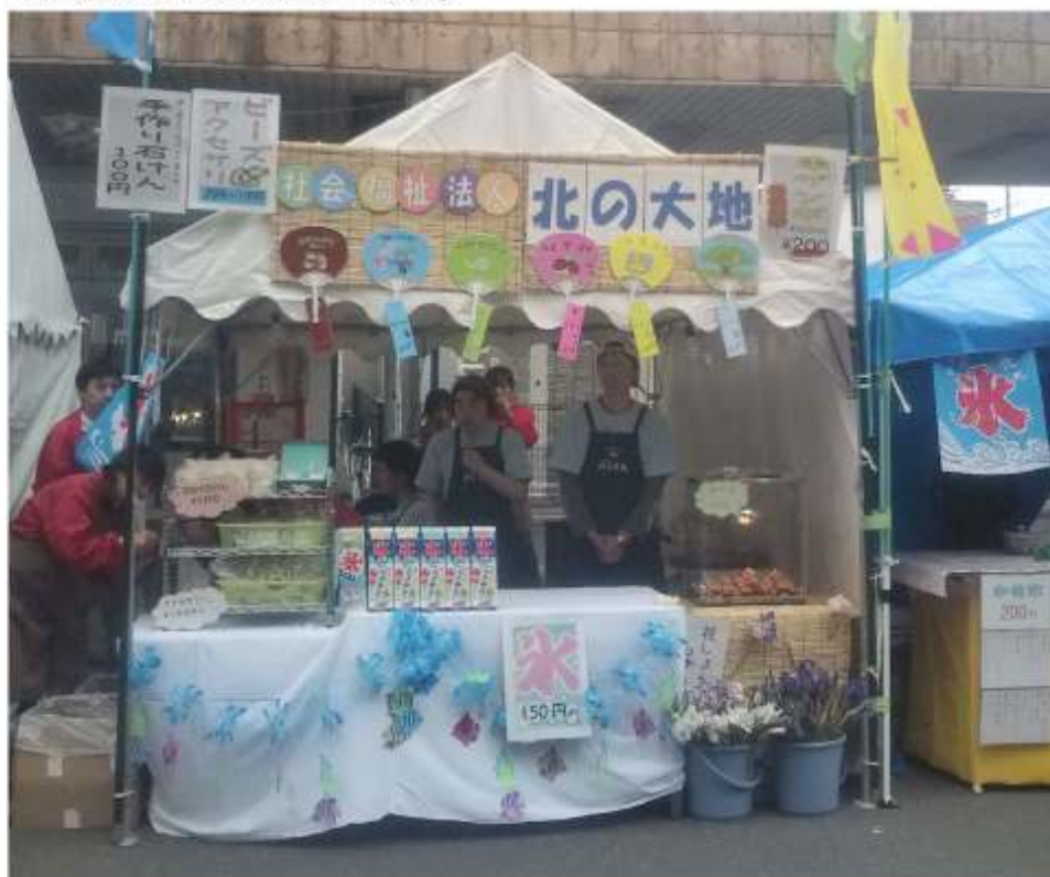
↑ほんちまつり開店直前の様子

北の大地のお店も、新メニューの揚げたこ焼きなどが好評で、お蔭様で昨年を大幅に上回る売り上げを得ることができました。参加したメンバーへの還元金と北見市社会福祉協議会へ納める負担金を除いた収益の157,232円は、メンバー会に入金し、宿泊研修旅行のメンバー参加費補助などに用います。