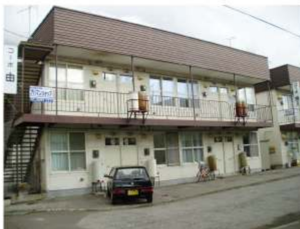
グループホーム北進2号外観→

※グループホームに関するお問い合わせは北の大地法人本部（電話0157-31-3343）まで。