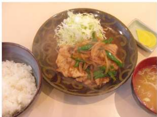
↑大好評のしょうが焼き定食。美味ですよ。